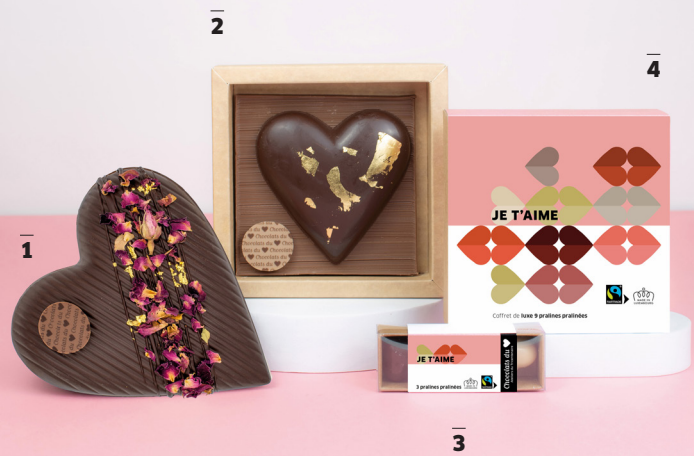
Sélectionnés par Gault&Millau Finest Chocolatiers in Belgium and Luxembourg.